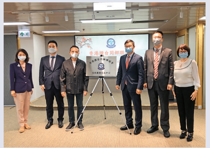
▲眾嘉賓為香港煙台同鄉聯誼會文化藝術交流中心揭牌。