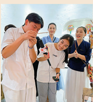
▲河南學子在非遗展示區了解文創產品。

21個劇場，700分鐘不重複的沉浸式劇目，要想全部看完需要2至3天時間。幻城作為目前中國規模最大的戲劇聚落群，通過移步換景的沉浸式手法，向觀眾講述着關於中原的故事。之所以將其稱為「沉浸式劇目」，是因為表演過程中，觀眾和演員之間並沒有清晰的身份界限，坐在你身邊的「觀眾」可能是演員，而你可能也正是劇中之一，這種強烈的代入感讓觀眾對劇情有了更為深刻的體驗和理解。