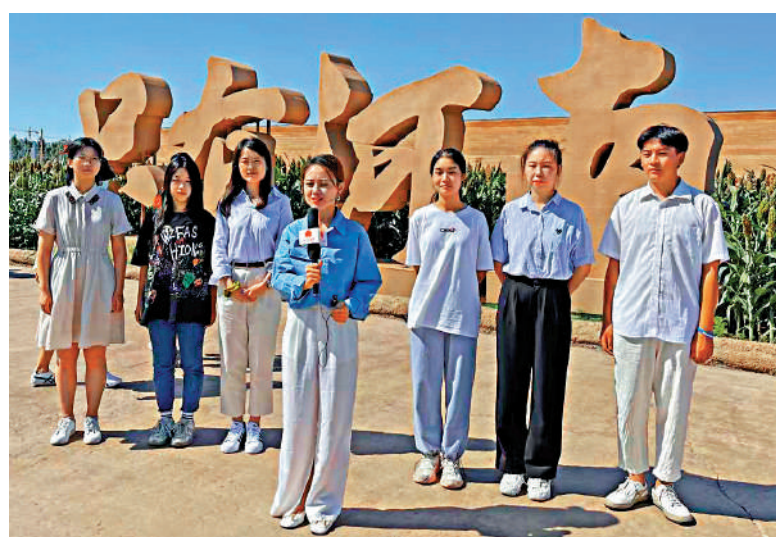
▲河南學子一行在「只有河南·戲劇幻城」的高粱地前合影。