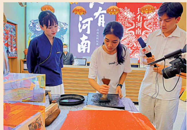
▲河南學子體驗製作木版年畫。

在採訪過程中，一處獨具文化魅力的地坑院引起了大家的關注。這裏不僅集合了河南傳統知名餐飲業態，更有若干非遗主題館等多種豐富業態，「河南人的雙肩不僅舉得起糧食的重擔，雙手更能玩轉美好生活。」「只有河南·戲劇幻城」的非遗講解員說，「在地坑院中最具代表性的三大非物質文化遺產是來自淮陽縣的泥泥狗、泥咕咕以及布老虎。每一種非物質文化遺產都是通過非遺人精心打磨，純手工製作而成的。」以泥泥狗為例，它是淮陽縣著名的傳統工藝品，其作為信仰和祭祀的載體，原始部落的圖騰符號，經常被用來驅災辟邪。製作泥泥狗的步驟並不複雜，非遺傳承人選用黃河之土，經過整泥、捏製、上色即可完成，但卻需要極大的耐心和精細的手法。