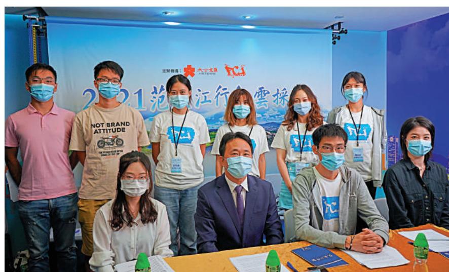
▲「2021范長江行動」中原行雲採訪活動9月24日舉行。圖為啓動儀式香港會場合影。