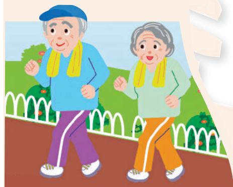
▲長者做適量運動，有助增強肌肉力量。