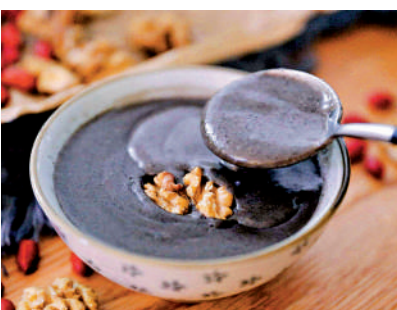
▲黑芝麻核桃糊可潤五臟。