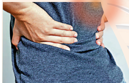
▲腰背肌肉酸痛是都市人常見毛病。