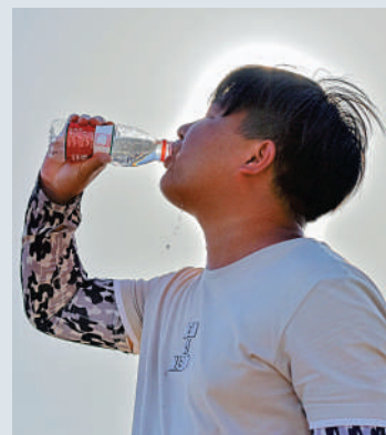
▲腎結石病人宜多喝水。