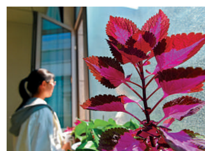
▲照顧情緒病患者，要有同理心。