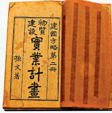
孫中山著作《實業計劃》。

拿上港澳通行證，申請一個簽證，到香港來一場說走就走的旅程，是新冠肺炎疫情發生之前，廣東人休閒度假的例牌節目。但不知道，即使當年香港受到殖民統治，到新中國建立之前，省港澳居民可以自由往來，不需任何證件即可通關。這種地緣關係，讓粵港澳無論是政治還是經濟的聯繫從來都密不可分。孫中山在香港讀書的時候，有時間就會四處走走，「見其秩序整齊，建築闕美，工作進步不斷」，香港的城市建設讓他留下很深刻的印象，也為他以後思考國家建設提供了諸多的參考。