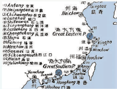
孫中山著作《建國方略》中規劃建設的南方大港。