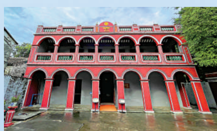
▲中西建築風格合璧的孫中山故居。

如果要給中國的鄉村列一個排名榜，廣東中山的翠亨村一定榜上有名。作為中國民主革命偉大先驅孫中山的故鄉，這裏每天都吸引着成千上萬的遊客慕名而來。 翠亨村東朝珠江口，隔伶仃洋與深圳、香港相望。村子雖小，卻並不閉塞，因為它臨近港澳，不少鄉人到這兩個港口謀生，甚或取道出洋。因此，港澳成為了當地人了解世界的窗口。少年時代的孫中山，不時從親友長輩口中聽到關於港澳以至外國的種種趣聞。 曾經的小鄉村，如今已是孫中山故里旅遊區。位於孫中山故居西北側的孫中山紀念館，序廳正中布置了孫中山先生的鑄銅雕像，雕像的背景模仿孫中山故居院門，刻畫出孫中山先生站在家門