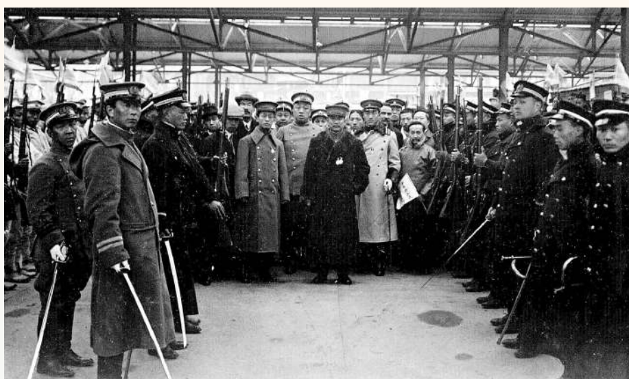
一九二一年一月一日上午，孫中山從上海乘坐火車前往南京就任臨時大總統，近萬人在火車站送行。