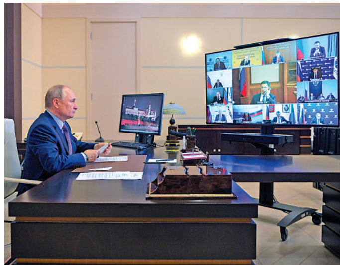
▲俄羅斯總統普京6日主持關於能源產業發展的視像會議。路透社

【大公報訊】綜合路透社、彭博社、《金融時報》報道：歐洲天然氣和電力價格近日刷新歷史紀錄，能源危機愈演愈烈。俄羅斯總統普京6日表示，俄羅斯準備好穩定全球能源市場，並增加對歐洲的天然氣供應，為局勢降溫。與此同時，俄羅斯副總理諾瓦克表示，德國若能盡快批准「北溪-2」管道，歐洲「氣荒」或將有所緩解。