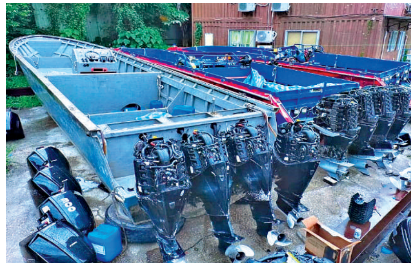
▲警方在八鄉粉錦公路一個倉庫，搜獲五艘懷疑用作走私的改裝快艇。