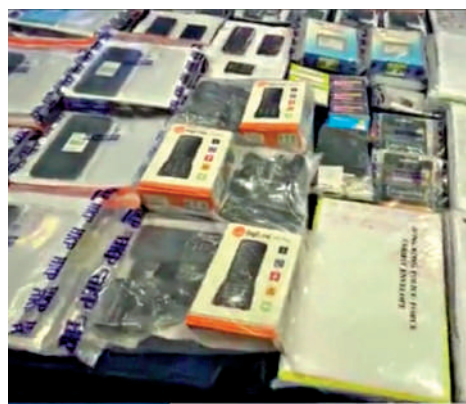
▲警方搗破一個由黑社會操控的詐騙集團，行動中檢獲大批文件及證物。

財富情報及調查科總督察黎偉俊說，騙徒今年六月起接觸多名事主聲稱可代申請計劃，開設虛假網站誘使事主開設虛假銀行戶口，要求事主提供個人資料，並利用該些資料製造虛假紀錄去申請計劃。但騙徒取得貸款後，便將該筆款項轉到八名傀儡成員操控的12個傀儡戶口中，部分款項則匯到外地，警方在行動中在電話中心發現與計劃相關的資料及文件，目前已拘捕其中七名傀儡成員。