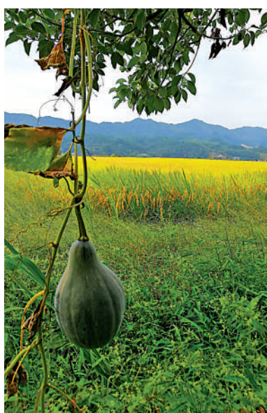
▲田間農家栽種的瓜果。作者供圖

田裏收的稻穀，一車車往回拉，有的攤放在村敬老院的空地上。我們趕去敬老院，拎起木耙有模有樣地攪動翻曬，重溫往日下鄉勞動的場景。晾曬透了，揚虛留實，顆粒歸倉，我們的心靈也收穫豐悅。