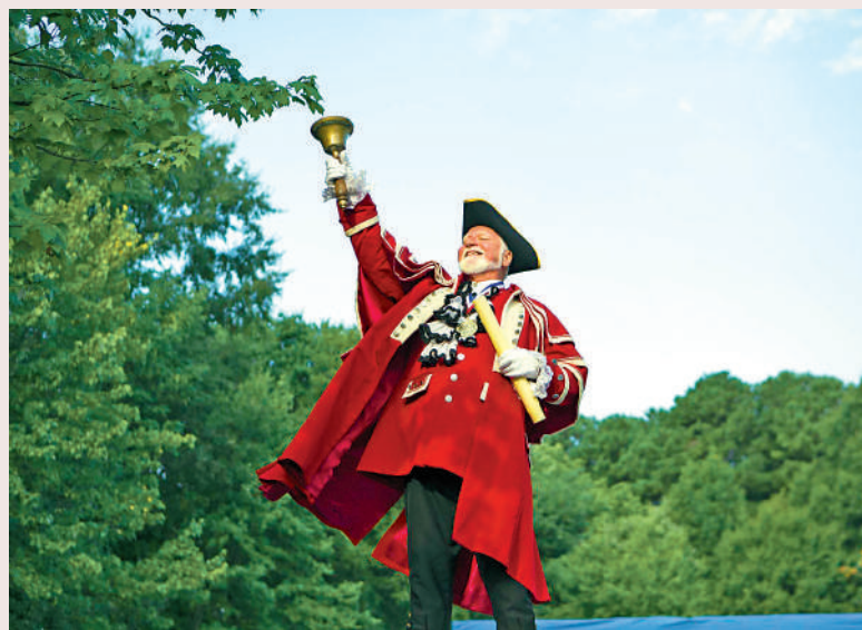
歐美等地仍保留街頭公告員（town crier）的傳統。