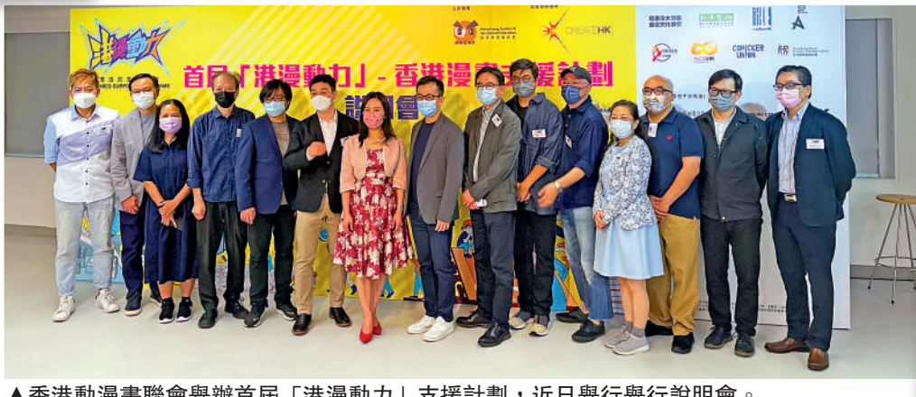
▲香港動漫畫聯會舉辦首屆「港漫動力」支援計劃，近日舉行舉行說明會。