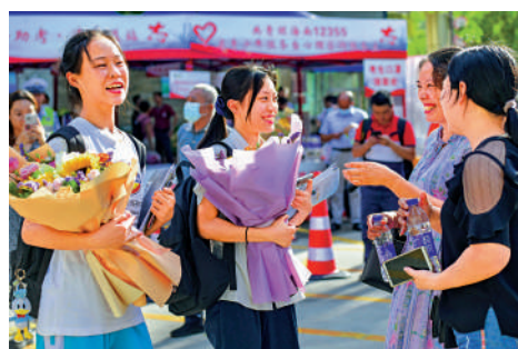
▲6月10日，海南省海口市中學考點外，家長為走出考場的考生送上鮮花。