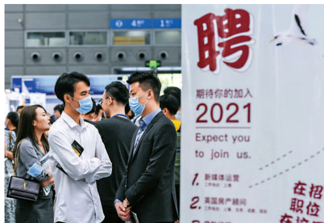
▲在內地，教師職位成為「香餡餅」。圖為求職人員在招聘會上與企業交流。

一位哥倫比亞大學畢業歸國的畢業生向記者表示，疫情以來，許多行業受到影響，職業前景不明朗，相比之下，當老師工作穩定，且工作環境相對簡單，擁有超長假期，且對社會更有價值，因此傾向於從教。她指，目前已經收到兩份深圳的教師崗位的offer，分別來自公辦學校和一個國際學校。「更傾向於公辦學校，在編教師的工作相對更穩定，壓力較小，也希望在公辦教育中帶入自己在國外學習的一些好的理念。」