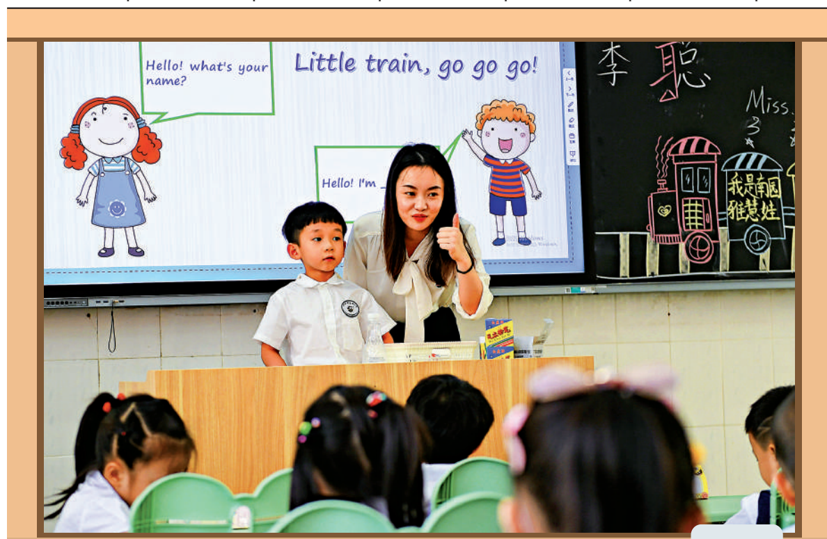
▲9月1日，在深圳市福田區南園小學，一名來自香港的青年老師在英語課上鼓勵孩子用英語自我介紹。