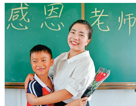
▲9月10日，湖南省永州市江永縣第三小學學生向老師送上鮮花。