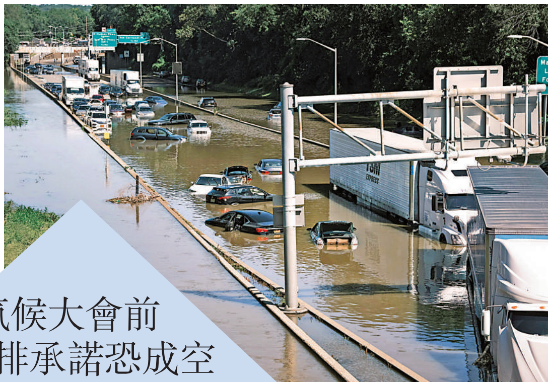
▲颶風「艾達」過境，紐約市9月2日道路積水嚴重。