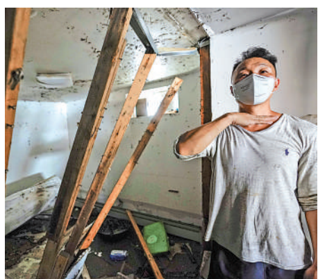
▲紐約9月初洪災，一名華裔男子的地下室所嚴重受損。

目前，拜登政府提出的1萬億美元基建法案仍在眾議院闖關。法案將撥款35億美元予聯邦應急管理局（FEMA）的洪水緩解援助計劃，以及投資數十億美元以改善道路和能源設施。但由於民主黨內未達成共識，法案表決多次延期。眾議院議長佩洛西將最後期限定於本月31日。13日，拜登警告，如果不改革基礎設施，美國將失去全球領導地位。