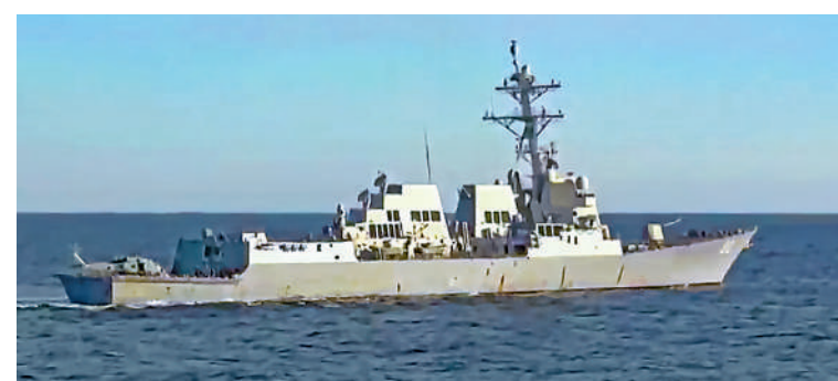
▲俄羅斯國防部15日發布美艦「查菲」號試圖入侵俄領海的照片。

國又派出新銳戰艦，美國抵近中俄演習區域的戰艦具有偵偵能力，旨在窺視並搜集軍事情報。「美國主要關注中俄軍演的緊密度究竟有多高，演練科目有哪些，是否已經實現了各個軍事演練科目中達到緊密聯繫等。」美艦進入不該進入的演習區，甚至一度要進入俄羅斯領海，必然會引起美俄軍方關係的緊張。