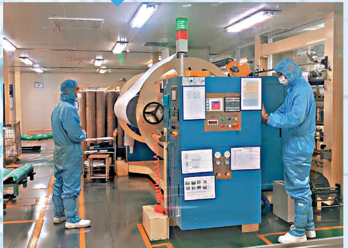
大陸通利科技公司與台企合作，在新材料領域取得很大進展。大公報記者陳昱攝。