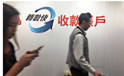
▲「轉數快」暫停服務5個多小時，與銀行運作無關，相信不會造成混亂。

儲值支付工具營運商會逐漸恢復相關服務。金管局表示，此次系統維護由於涉及系統遷移安排及提升，較過往的系統維護工程複雜，在過程中出現未能預見的情況，已按計劃啟動後備方案並恢復提供服務，對造成的不便深表歉意。有資訊科技界人士認為，今次事故或與