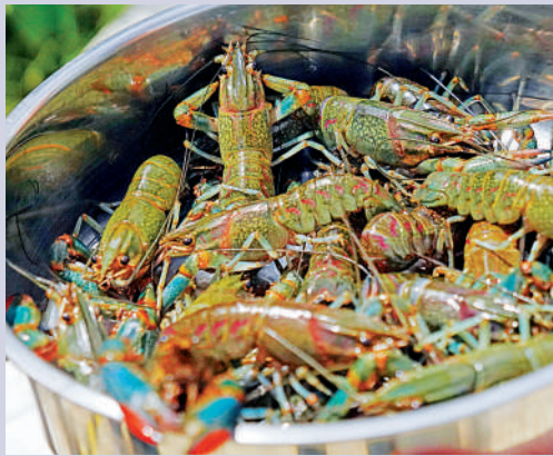
▲藍龍蝦生長速度快、存活率高。