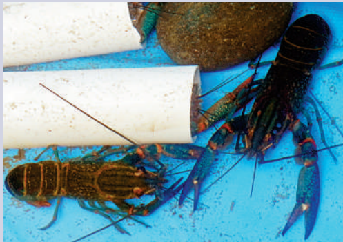
▲可製造環境漩渦的水泵有助藍龍蝦增加活動能力。