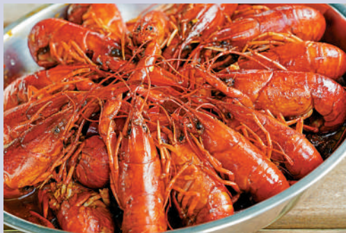
▲由於藍龍蝦在清澈的水質生長，用鹽水煮熟，不會帶有腥味。