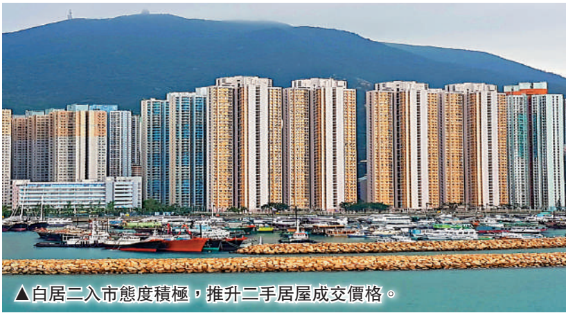
▲白居二入市態度積極，推升二手居屋成交價格。

業界分析指，每年數千個白居二名額湧入市，未補地價的二手居屋求過於供，身價大幅上漲，業主見持貨三數年便有錢賺，紛紛以高價轉售圖利，令資助房變成「搖錢樹」，建議當局考慮設定轉讓限制，例如資助房業主轉讓單位時，只可以原價或按通脹計價售回政府，由當局再轉售予市場輪候人士。