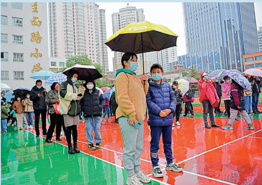
▲19日，在蘭州市城關區核酸檢測點，居民排隊做核酸檢測。

【大公報訊】由「上海7人旅遊團」引發的疫情傳播鏈再次延長。截至19日17時許，包括陝西（8例確診）、內蒙古（7例確診）、甘肅（4例確診+2例無症狀感染者）、寧夏（2例確診）、湖南（1例確診）、貴州（1例確診）、北京（1例確診）在內的7個省區市已陸續報告新增至少26例陽性病例。其中，多個陽性病例均曾在10月中旬赴內蒙古額濟納旗旅行外，多次出現在病例行程中的桐楠閣餐廳亦成為疫情關注的焦點。目前，該餐館共涉及5名員工確診，14名食客陽性。