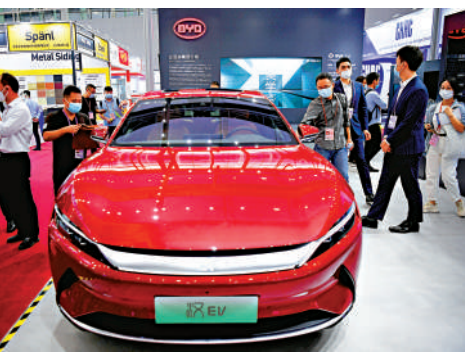
▲比亞迪新能源汽車亮相第130屆廣交會。

【大公報訊】記者馬靜北京報道：微芯片短缺正影響着全球汽車製造企業的生產。工業和信息化部新聞發言人、運行監測協調局局長羅俊傑19日在國新辦發布會上表示，因為芯片短缺，確實造成很多汽車企業減產或者短期停產，影響明顯。但是綜合各種跡象看，預計四季度將較三季度有所緩解。