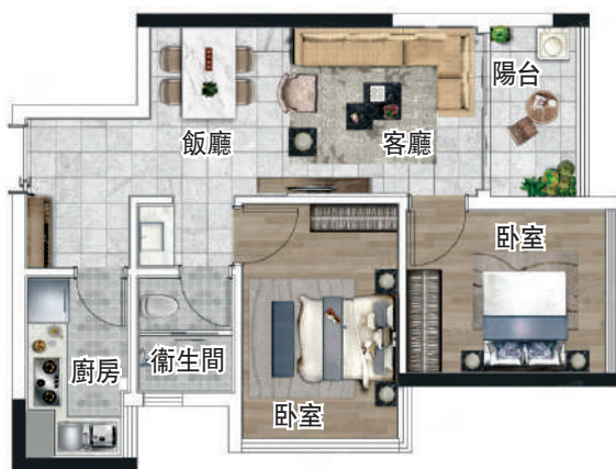
▲珠江西灣里的62平米兩房單位，為該樓盤的性價比之選。