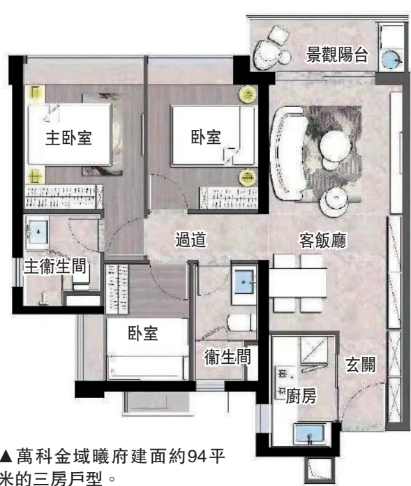
▲萬科金域曦府建面約94平米的三房戶型。