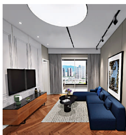
▲珠江西灣里樣板間。VR看房截圖