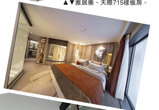
▲雅居樂·天際715樣板房實拍圖。