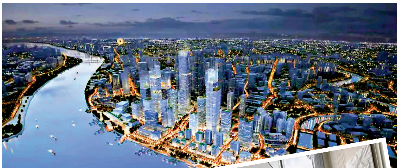
廣州荔灣白鵝潭片區規劃效果圖。

近段時間，廣州荔灣白鵝潭片區動作不斷。太古地產與珠江實業近期簽署合作意向，計劃攜手在荔灣聚龍灣片區打造珠江太古商業項目。這是繼太古匯之後，廣州第二個太古項目將落戶白鵝潭聚龍灣片區。太古項目作為奢侈品商場代表，該項目選址對花地灣甚至是整個廣州西，都是一大利好。此外，白鵝潭聚龍灣片區正在進行荔灣迄今為止規模最大的舊城混合改造項目。在荔灣區「十四五」規劃中，計劃將1208.8億元（人民幣，下同）巨資投向城市更新。