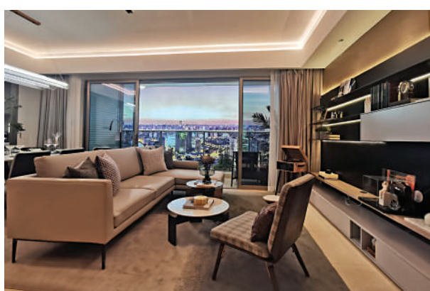
▲萬科金域曦府樣板間的客廳。