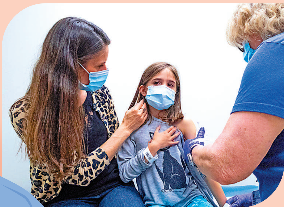
▲美國一名9歲女童4月參加輝瑞兒童疫苗試驗。