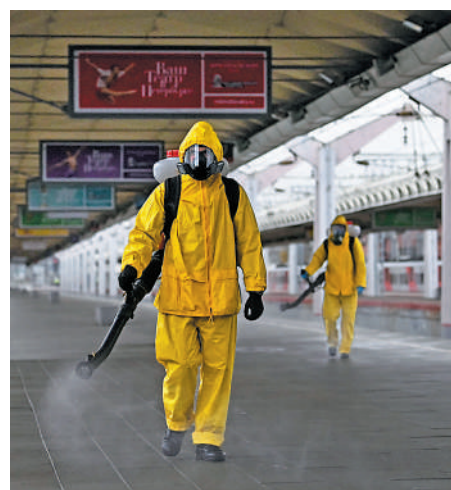
▲工作人員19日為莫斯科一處火車站內消毒。

莫斯科政府21日宣布於本月28日至下月7日再度封城，除了販賣必需品的超市和藥房外，其他商舖必須暫停營業。學校和幼稚園亦要關閉。酒吧和餐廳只准外賣，不准堂食。劇院和博物館仍然開放，但設有入場人數限制，另外，入場人士需要戴口罩及出示疫苗接種紀錄。