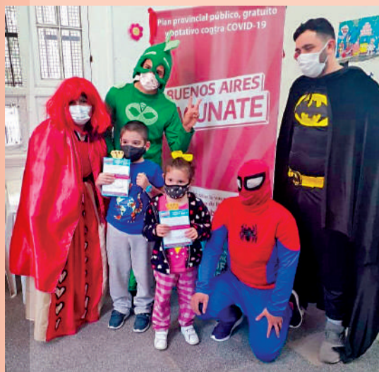
▲阿根廷一間兒童疫苗接種中心內，工作人員扮成漫威電影人物與小朋友合影。

輝瑞兒童疫苗每劑劑量10微克，為青少年及成人劑量的三分之一。研究發現，兩組兒童都沒有出現重症，但已接種的兒童症狀相對輕微。此外，這批完全接種疫苗的兒童，所產生的抗體水平與接種全劑量的青少年相若。研究亦發現，接種兒童會出現注射部位疼痛、疲勞和頭痛等輕微副作用，但由於受試者只有幾千人，暫未能找出心肌炎等罕有副作用的數據。同日，FDA科學家發布對輝瑞兒童疫苗的審查結果，對其有效性和安全性予以肯定。專家表示，該疫苗預防重症和住院等潛在益處，明顯超過罕見心肌炎的罹患風險。