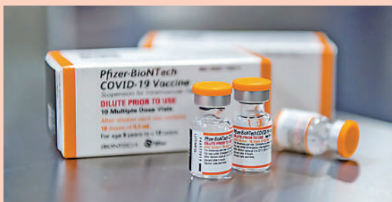
◀輝瑞兒童疫苗使用黃色瓶蓋與包裝。美聯社

【大公報訊】綜合美聯社、《華爾街日報》、新華社報道：美國秋季開學以來兒童染疫率急升，美國藥廠輝瑞與德國BioNTech於22日宣布，針對5至11歲兒童的臨床試驗顯示，其合作研發的兒童疫苗效力達90.7%，且副作用輕微。美國食品和藥物管理局（FDA）專家同日表示，兒童接種輝瑞疫苗的好處大於風險。FDA將於周二（26日）投票，決定是否批准輝瑞兒童疫苗緊急授權。預計11月起，全美2800萬名兒童可打針。