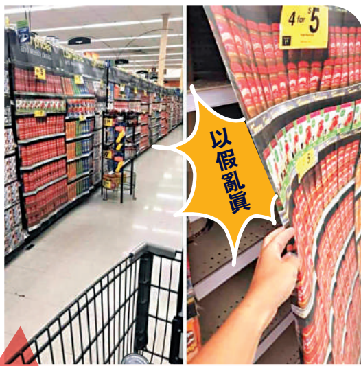
▲美國一超市用印滿貨品的紙板來掩蓋空空的貨架。