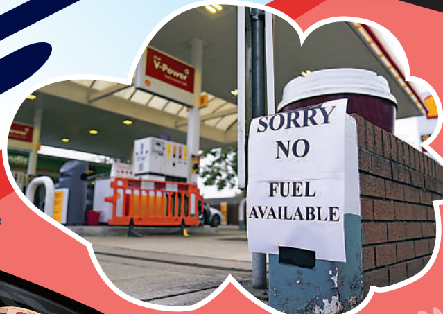
▲英國一加油站貼出「無油」告示。