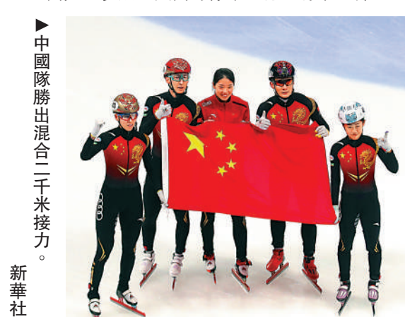
▶中國隊勝出混合二千米接力。

本站賽事既是北京冬奧會的測試賽，也是北京冬奧資格賽。作為北京冬奧前的「模擬考」，北京站比賽完全參照冬奧賽時標準進行，有來自韓國、