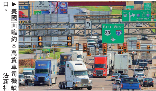
▲美國面臨約8萬貨車司機短缺

8月，FDA終於向各地港口發出警告，要求扣留該公司發出的貨物。然而自2月以來，這家屢遭投訴的泰國公司已向美國運送了總計8000萬隻手套，貨物流向至今未明。其中一家進口商Uwepport表示，由於無法按計劃將手套提供給醫療公司，只能以較低價格售予食品加工廠、酒店、食肆等其他分銷商。去年12月，泰國衛生部門曾發現幾處非法醫療手套加工廠，但許多工廠此後仍在營業。