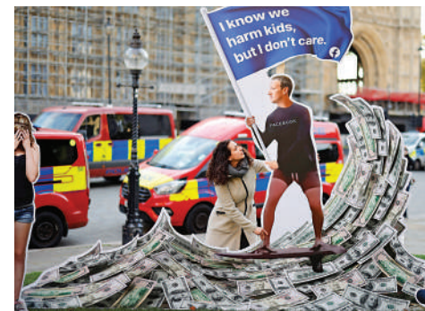
▲英國民眾設立人形立牌反對Fb的一系列政策。

行官朱克伯格出庭作證。而CNN的系列報道則關於Fb對於散播仇恨及暴力言論的「不作為」、該公司對一些非英語語言內容的管理鬆散，以及有剝削者利用其平台對家庭勞工進行奴役等內容。除了失去用戶信任、遭到監管質詢外，Fb公司內部也正出現巨大裂痕。幾份內部文件指出，不少Fb員工對公司前景十分擔憂。去年12月，在Fb內部網站上，曾有員工留言指對整間公司的領導力信心下降。