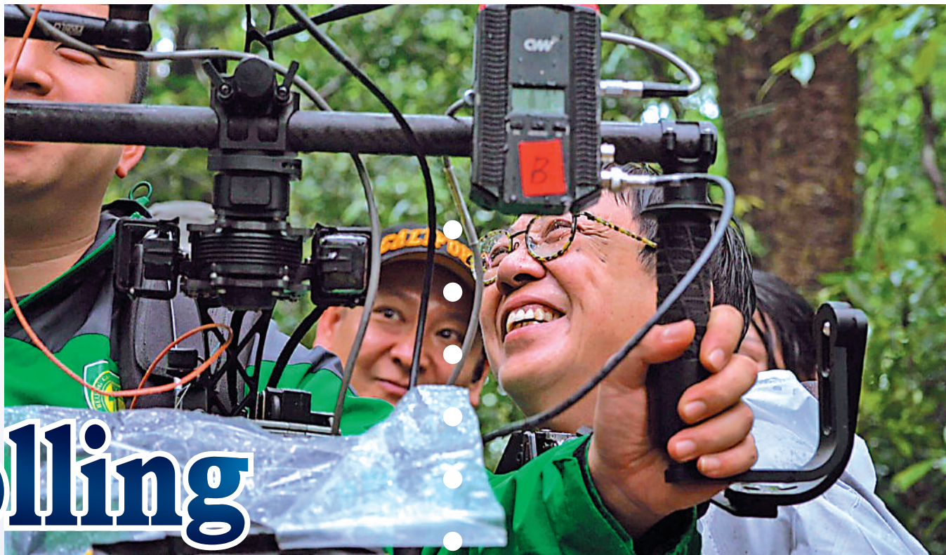
▲許鞍華（右）是當年香港電影新浪潮先鋒之一。