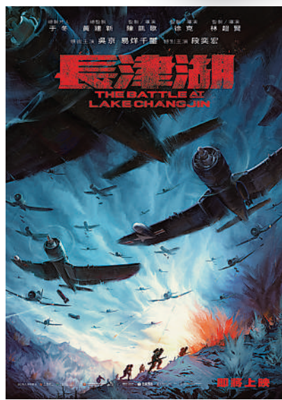
《長津湖》以抗美援朝戰爭為主題。

不少網友均表示，希望《長津湖》這樣的大製作能盡快在香港上映。有影人亦表示，自從香港導演參與執導內地戰爭歷史題材的電影後，它們對觀眾的吸引力大增，相信《長津湖》亦會在香港受到追捧。