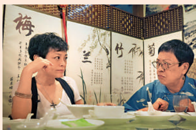
▲張艾嘉（左）與許鞍華交情極深，亦有亮相《好好拍電影》。

《好好拍電影》與其說是一部電影紀錄片，不如說是通過家人的、好友的、同事的……通過眾多「身邊人」的視角，還原了一個立體的、有血有肉的許鞍華。很喜歡《好好拍電影》的英文名《Keep Rolling》。這是在拍攝現場導演常用的一個指令，多數是用在拍攝過程中出了些許意外，但可以接受或者有意外驚喜的時候，導演用來指示攝影師「不要停機，繼續拍攝」。無論《第一爐香》對於許鞍華導演是驚，還是喜，希望這位華語影壇獨樹一幟的導演都能夠Keep Rolling。