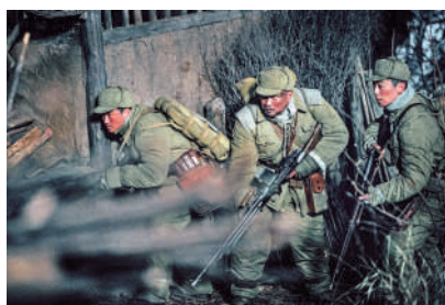
《長津湖》由陳凱歌、徐克及林超賢執導。