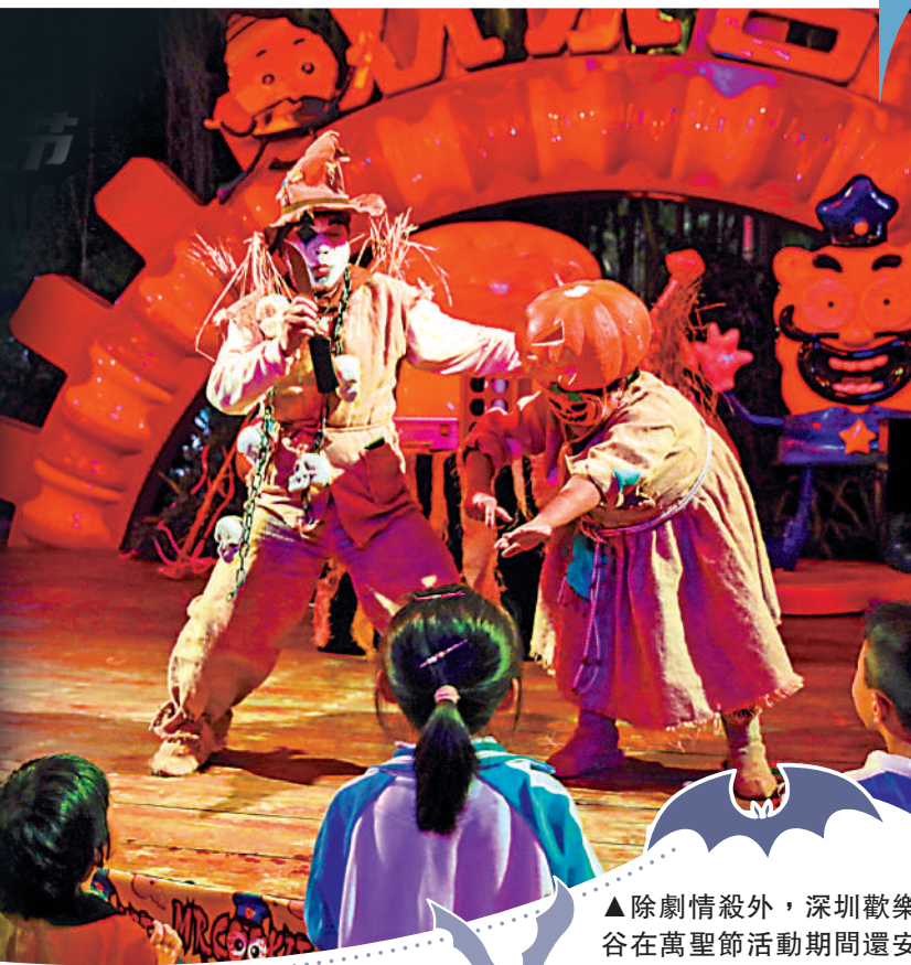
▲除劇情殺外，深圳歡樂谷在萬聖節活動期間還安排了精彩表演。