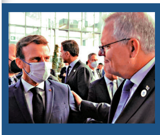
▲莫里森（右）10月30日與馬克龍打招呼。

美國與歐盟於10月30日達成《全球可持續鋼鋁協議》，以解決雙方貿易爭端。美國宣布取消前總統特朗普對歐盟鋼鋁產品加徵的關稅，允許「有限數量」的歐盟鋼鋁產品享受零關稅；歐盟亦將下調針對美國商品的報復性關稅。消息人士稱，歐盟每年可免關稅向美國出口330萬噸鋼材。 美國總統國家安全事務助理沙利文稱，新協議移除了美歐間主要芥蒂之一。但有專家批評華府反應遲緩，直到遭遇供應鏈危機才採取行動。（華盛頓郵報）