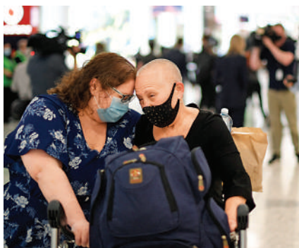
▲澳洲民眾1日在悉尼機場與許多未見的親人相擁。