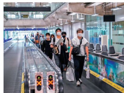
▲泰國曼谷機場1日迎來首批外國遊客。