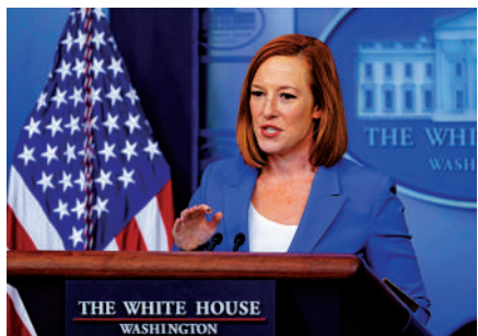
▲美國白宮新聞秘書普薩基10月31日確診。

陪同拜登前往歐洲的高皮耶11月1日表示，拜登10月31日接受了檢測，結果呈陰性。她還稱，拜登接受檢測並不是因為普薩基確診，而是因應「進入英國」參加COP26的防疫要求。據報道，與拜登一同前往歐洲的所有官員在出發前已每日接受檢測，並且均已完全接種疫苗，包括拜登在內的部分人士還已接種加強劑。