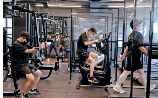
▲自1日起，韓國民眾進入健身房須出示「疫苗通行證」。