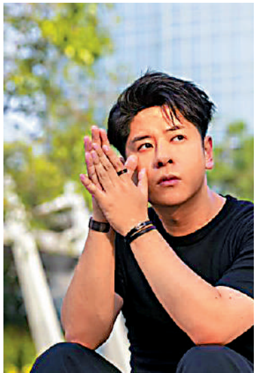
▲許廷鏗戴上黑色皮革黑鑽石手鐲配品牌男士系列首飾。

今次品牌的設計，可以根據個人喜好訂製，可選擇單獨佩戴或與其他My Move手鐲疊戴，輕鬆打造不同風格。