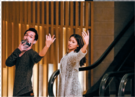
▲藝術家圍繞「空間」和「律動」的概念開展探索與創作。