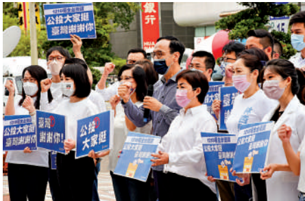
▲中國國民黨呼籲民眾用「公投」選票教訓施政不力的民進黨當局。中通社

【大公報訊】據中通社報道：中國國民黨日前舉行第21屆第1次全大會，會議通過的新版國民黨政策綱領中提到，該黨將延續過去黨章、黨綱內容，