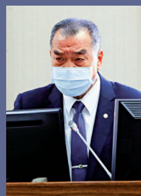
▲台軍戰力備受質疑。圖為台「防長」邱國正近日證實台美軍隊在關島聯訓。資料圖片

特點 此機型被稱為「坦克殺手」、「地表最強攻擊直升機」。台灣於2013年購買型號為AH-64E的阿帕奇直升機，數量30架。