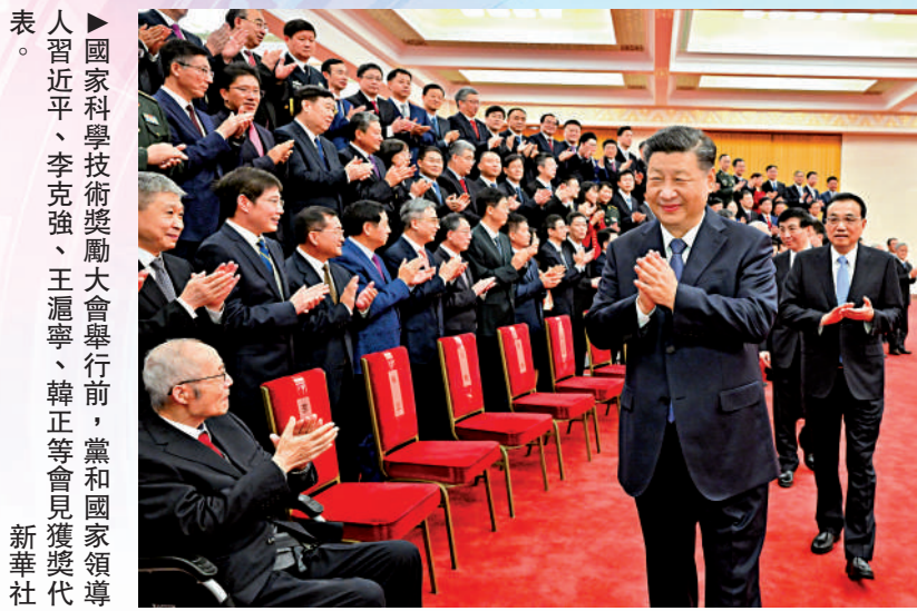
▲國家科學技術獎勵大會舉行前，黨和國家領導人習近平、李克強、王滬寧、韓正等會見獲獎代表。