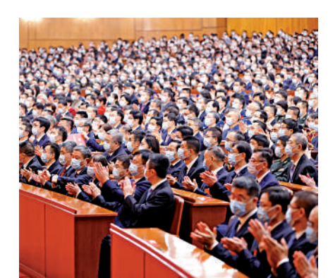
▲參加國家科學技術獎勵大會的代表為獲獎者鼓掌。