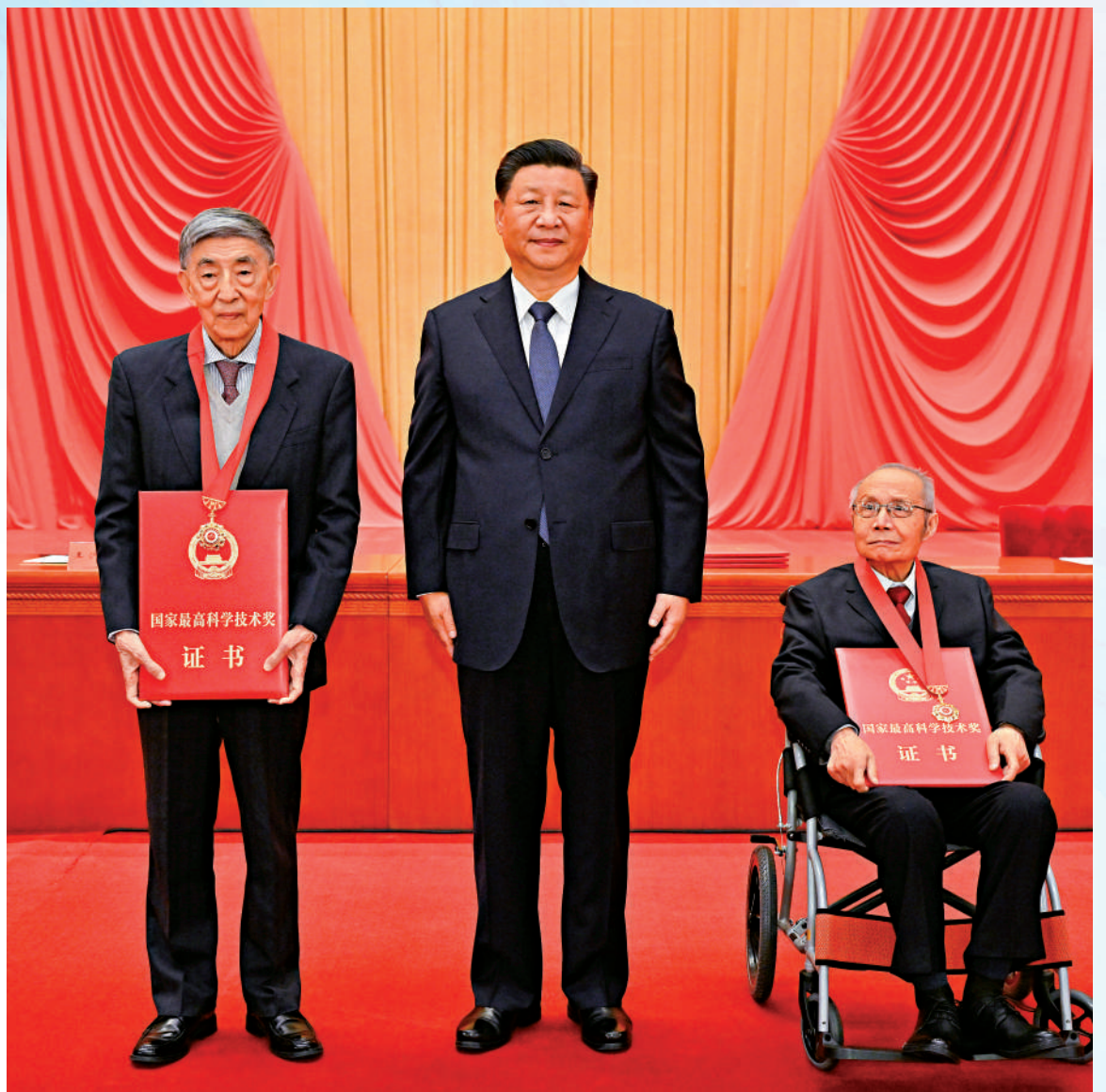
▲11月3日，二〇二〇年度國家科學技術獎勵大會在北京人民大會堂隆重舉行。中共中央總書記、國家主席、中央軍委主席習近平向獲得二〇二〇年度國家最高科學技術獎的中國航空工業集團有限公司顧誦芬院士（右）和清華大學王大中院士（左）頒發證書。

【大公報訊】綜合新華社、中新社報道：中共中央、國務院3日上午在北京隆重舉行國家科學技術獎勵大會。習近平、李克強、王滬寧、韓正等黨和國家領導人出席大會並為獲獎代表頒獎。中國科學院院士、中國工程院院士、新中國飛機設計大師顧誦芬，中國科學院院士、國際著名核能科學家王大中，共同獲得2020年度國家最高科學技術獎。大會上，習近平向顧誦芬院士和王大中院士頒發獎章、證書。