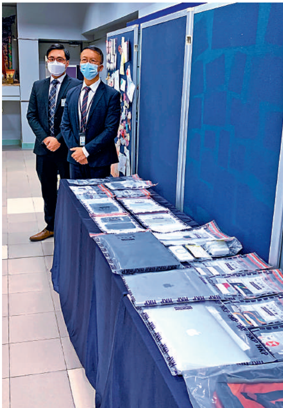
▲▼一名青年涉偷拍女生裙底影片及照片兜售被捕，警方展示大批證物。 大公報突發組攝

警方提醒市民，《2021年刑事罪行（修訂）條例》已於10月8日生效，就窺淫、非法拍攝或觀察私密部位，發布源自上述兩項罪行的影像，以及未經同意下發布或威脅發布私密影像訂立特定罪行，四項罪行最高判囚五年。該條例亦適用於社交媒體，市民切勿以身試法。並呼籲家長留意子女安全，教導他們保護自己，若遇任何人作出可疑行為，應盡快報警。