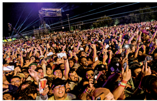
▲休斯敦一場音樂節5日擠滿觀眾。

這場名為「Astroworld」的音樂節原定一連兩日舉行，主辦方宣布取消所有活動。這也是自2003年羅德島一處夜總會大火造成約100人喪生後，美國音樂會上死亡人數最多的一次。