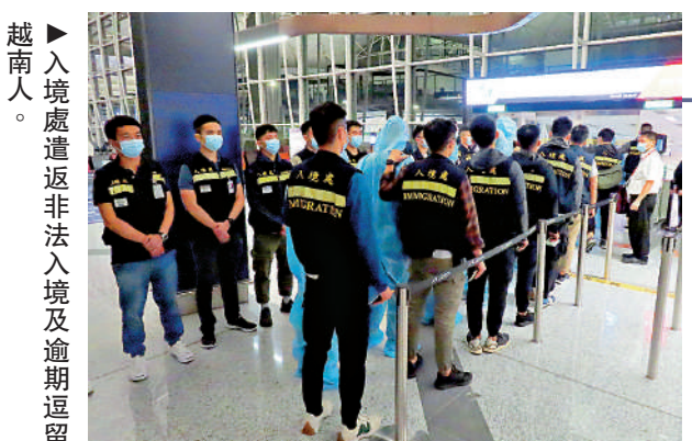
越南人。入境處遣返非法入境及逾期逗留