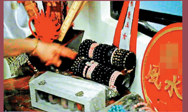
▲女風水師不斷游說客人購買經她作法、價值8800元的水晶手鏈。