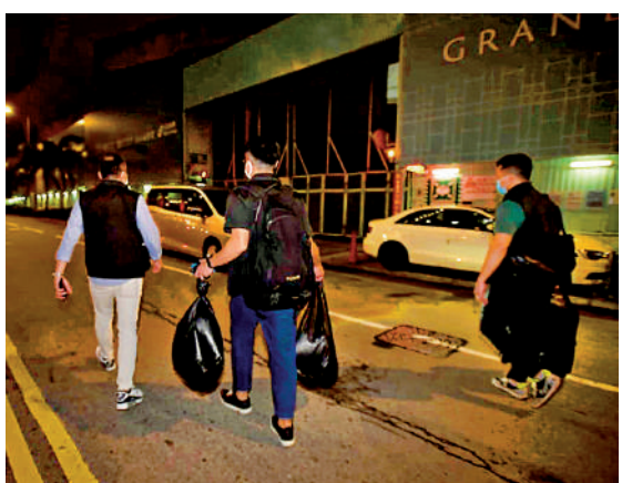
▲長沙灣凱閣發生夫婦疑攬子自殺案，探員事後到單位檢走多袋證物。

至昨中午，女家的親友接獲收債訊息，遂登門了解，其間有人透露曾攬子尋死，親友聞言大驚報警求助。警員調查後以涉嫌「企圖謀殺」拘捕夫婦兩人，並將他們的兒子送院檢查，情況穩定，案件列作企圖自殺及企圖謀殺處理。