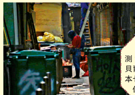
▲女風水師偕女友到大廈後巷隱蔽處「燒衣」。