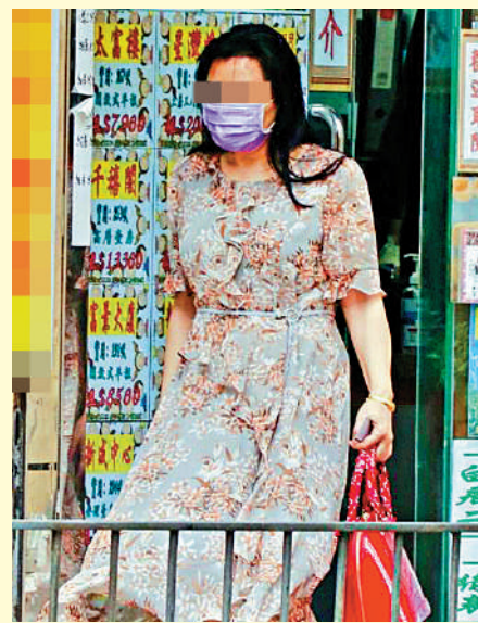
▲女風水師經常約地產經紀四處睇樓盤。

「好多都是同行中傷，惡意攻擊。」她強調其祖先是中國人，所有負面信息都是他人惡意誹謗。