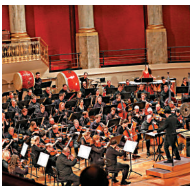
大灣區立冬打邊爐。

這次演出作為慶祝中奧建交五十周年，大概樂迷、讀者不一定記得，半世紀前建交時的音樂交流情