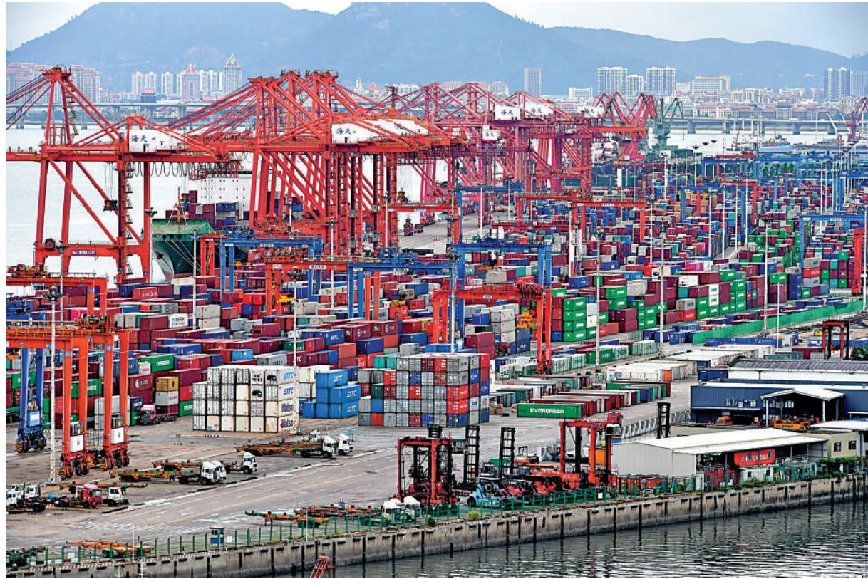
▲歐盟和其他一些國家全面取消對華普惠制待遇，對此當以平常心待之，這一變動也不可能對中國外貿出口產生多大影響。