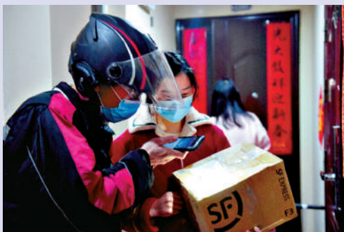
▲一位內地客戶正在簽收快遞。

後來的他，能記住所有客戶的車牌，會幫路過爆胎客戶換輪胎，送電視送貨上門時幫忙安裝……「以前當兵是服務國家，現在做快遞小哥是直接服務社會，都是服務，自己也算是老百姓美好生活的創造者。」「快遞小哥並不卑微，是城市的擺渡人，與各行各業的人員一樣，在為人民生活提供便利。」秦文沖說。