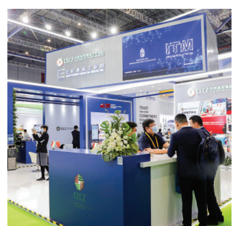
▲第四屆進博會期間，共建「一帶一路」國家展商紛紛亮相，分享產品和服務。

如今，人們更能讀懂習近平主席2018年11月對聯合國秘書長古特雷斯所說的話：「我提出構建人類命運共同體，倡議共建『一帶一路』，就是在反覆思考世界各國應如何在千差萬別的利益和訴求中實現共商共享、和而不同、合作共贏。」