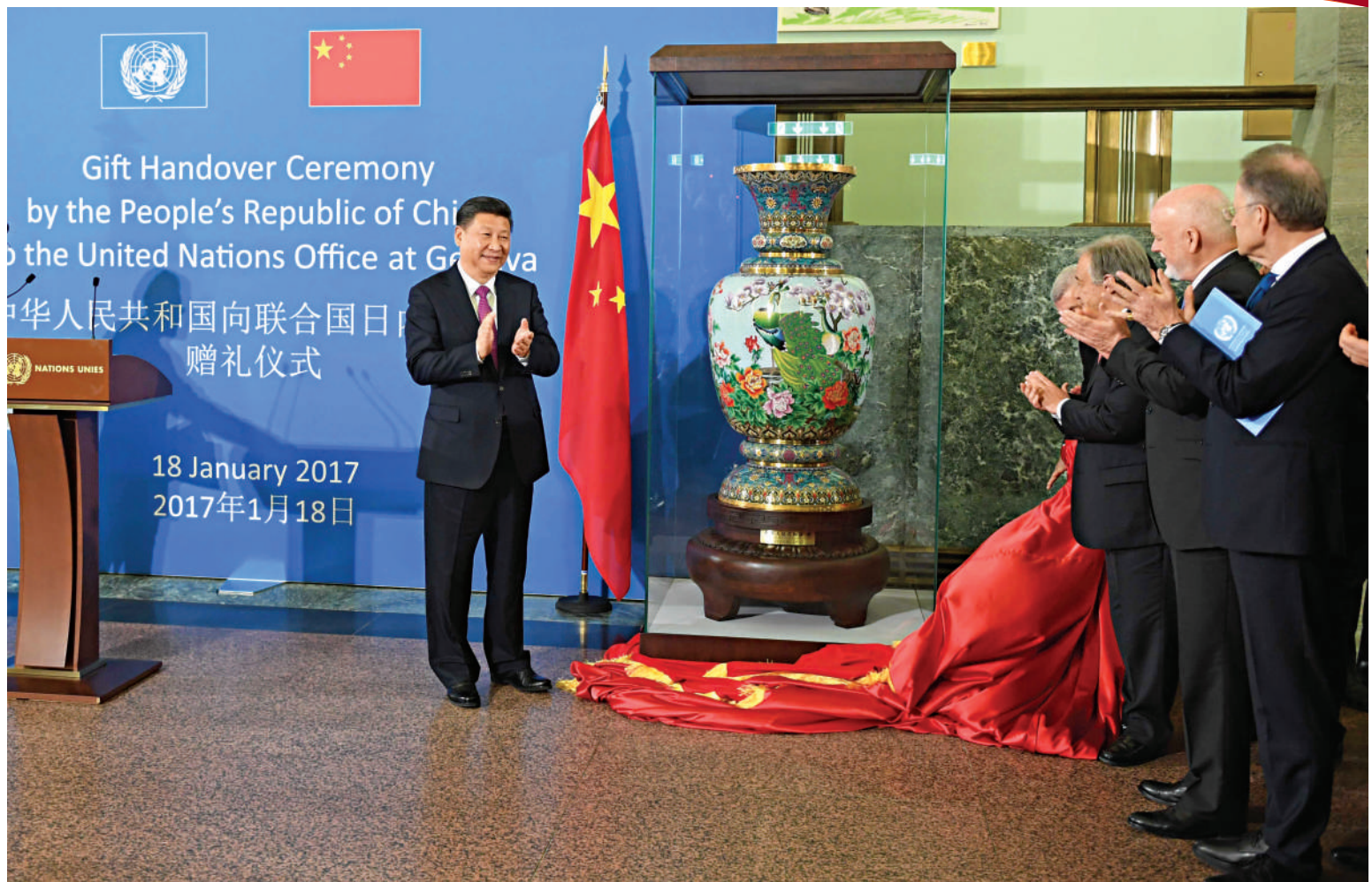
▶2017年1月18日，中國國家主席習近平在瑞士日內瓦萬國宮出席「共商共築人類命運共同體」高級別會議，並發表題為《共同構建人類命運共同體》的主旨演講。這是會議結束後，習近平出席中國向聯合國日內瓦總部贈禮儀式。

當今世界正經歷百年未有之大變局，中國正處於實現中華民族偉大復興的關鍵時期。要更好統籌國內國際兩個大局，堅持開放的發展、合作的發展、共贏的發展，通過爭取和平國際環境發展自己，又以自身發展維護和促進世界和平。