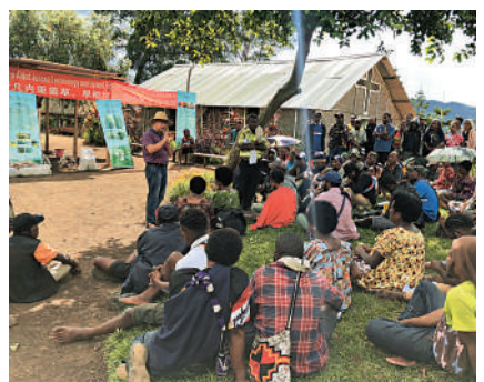
▲去年12月，中國專家在巴布亞新幾內亞中國援助巴新菌草和旱稻技術項目第9期培訓班上授課。 資料圖片

同年3月，習近平就任國家主席後首次出訪，在俄羅斯莫斯科國際關係學院發表演講時提出構建人類命運共同體理念。習近平主席強調，「人類生活在同一個地球村裏，生活在歷史和現實交匯的同一個時空裏，越來越成為你中有我、我中有你的命運共同體」，「各國應該共同推動建立以合作共贏為核心的新型國際關係，各