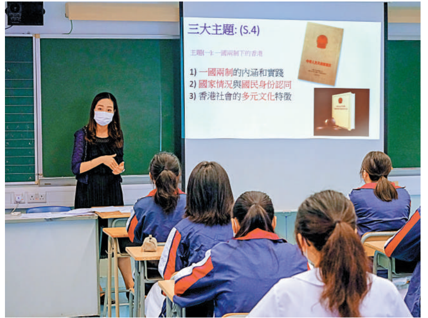
▲教育局公布於明年一月及二月，為部分公營學校教師進行《基本法》測試。

發言人說，《基本法》與日常生活息息相關，更是學校課程中十分重要的元素，須予以加強。「教師必須正確理解《基本法》，才能啟迪學生，幫助他們正確認識香港的憲制地位，以及建立他們對《基本法》和「一國兩制」的正面態