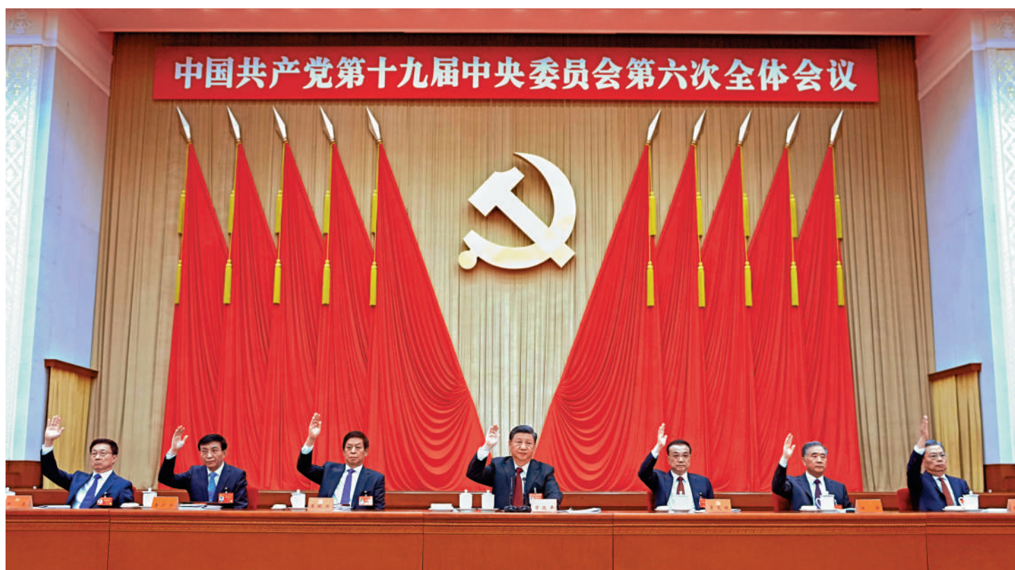
◀中國共產黨第十九屆中央委員會第六次全體會議於二〇二一年十一月八日至十一日在北京舉行。這是習近平、李克強、栗戰書、汪洋、王滬寧、趙樂際、韓正等在主席台上。