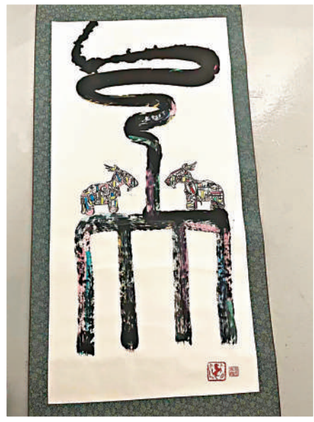
▲馬興文一幅關於馬的畫作。