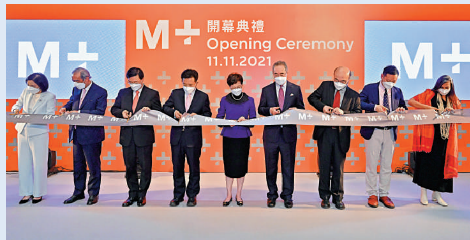
▲馮淑儀（左起）、夏佳理、李家超、王松苗、林鄭月娥、唐英年、羅仲榮、徐英偉、華安雅主持剪綵儀式。

28日）的入場時段。無預約的訪客或可參觀M+，但何時能進入博物館要視乎當時館內人數而定。