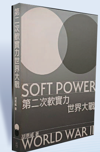
▲胡恩威著《第二次軟實力世界大戰》。