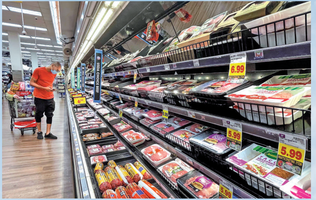
▲美國近月物價持續上漲，圖為洛杉磯民眾11日在超市購物。