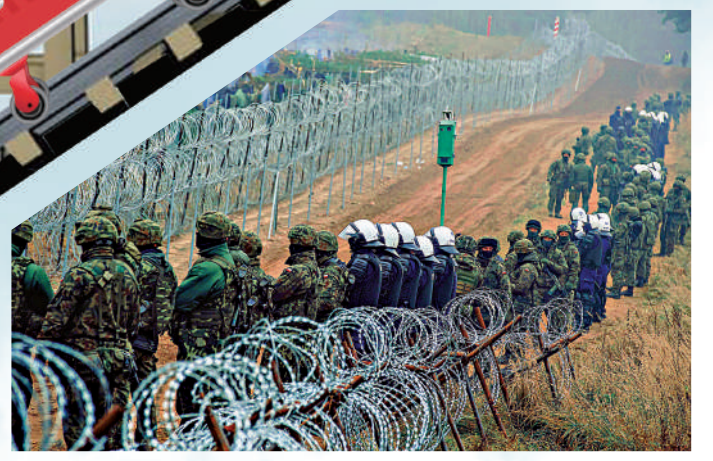
▲波蘭軍警11日在東部邊境攔截難民。

另外，歐盟質疑白俄故意引導難民前往歐洲，揚言對後者祭出新制裁；盧卡申科政府則準備以切斷歐洲天然氣供應回擊。俄羅斯天然氣經穿越白俄的亞馬爾（Yamal）輸氣管送到波蘭和德國。近月歐洲陷入能源危機，若供應受影響，勢必重創天然氣市場。