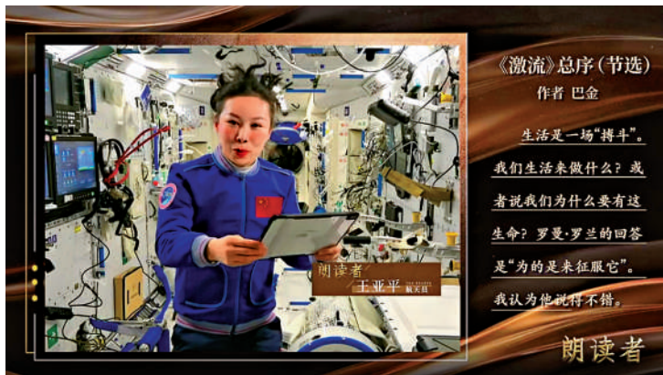
站神讀巴金的《激流》總序。視頻截圖

隨後，3位航天員先後朗讀了《激流》總序中的經典句子。「我知道，生活的激流是不會停止的，且看它把我載到什麼地方去！」讀完最後一句，翟志剛還輕鬆表演了一個太空後空翻。據了解，這段太空傳回的朗讀視頻是爲《朗讀者》節目錄製。