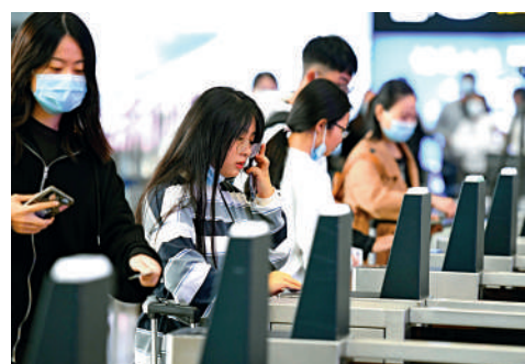
今年10月7日，旅客在石家莊火車站進站時進行人臉識別。

《徵求意見稿》提出，數據處理者利用生物特徵進行個人身份認證的，應當對必要性、安全性進行風險評估，不得將人臉、步態、指紋、虹膜、聲紋等生物特徵作爲唯一的個人身份認證方式，以強制個人同意收集其個人生物特徵信息。