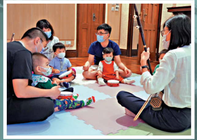
▼幼兒在成人陪伴下接觸中樂，表現雀躍。