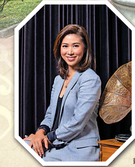
▲虎豹樂園原址及私人花園。