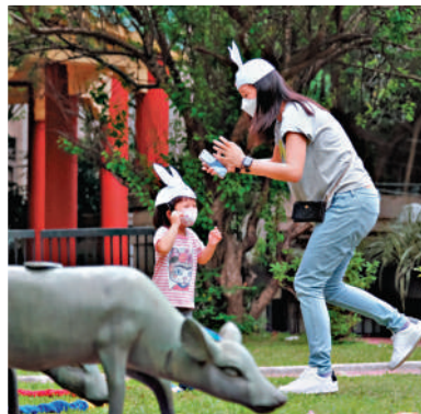
▲大小朋友在花園內玩樂。