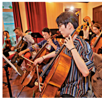
▲室內樂在虎豹樂園演出。