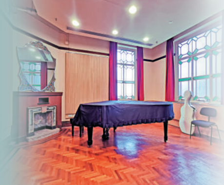
▲臥室被改造成練習室。