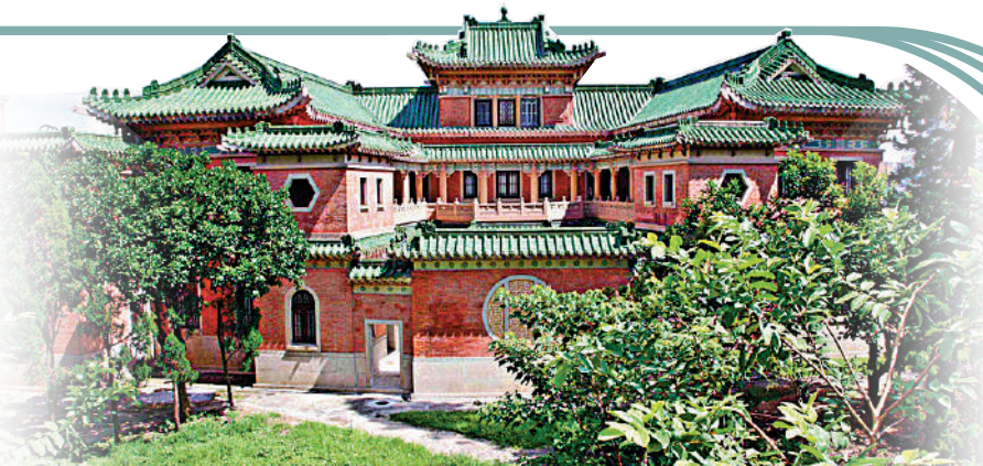
▲景賢里既有豐富而細緻的中式建築特色，又在結構、用料和設計上糅合了西方建築風格。