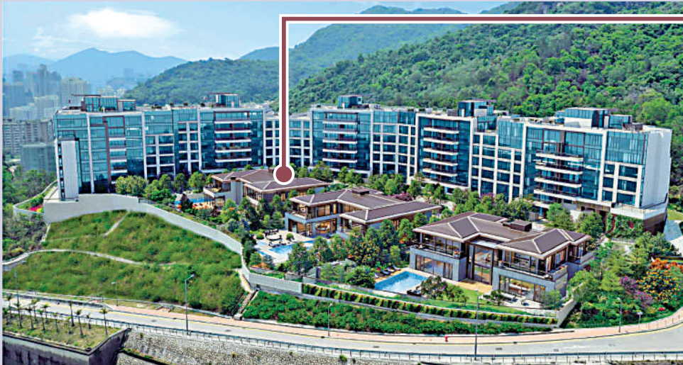
▲綫外由5座分層住宅及3座院墅組成，共提供64伙。