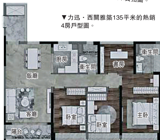
▼力迅·西關雅築135平米的熱銷4房戶型圖。