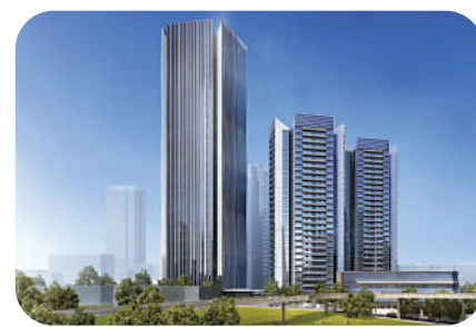
▲保利越秀天啟樓盤效果圖。

保利越秀天啟預計熱銷戶型將是東南向，可以望江的121平米4房單位。記者踩盤後認為，總體來看，戶型設計方正實用，使用率高，分區設計也合理，新購家庭、