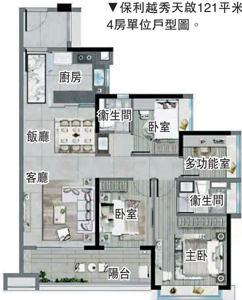
▼保利越秀天啟121平米4房單位戶型圖。