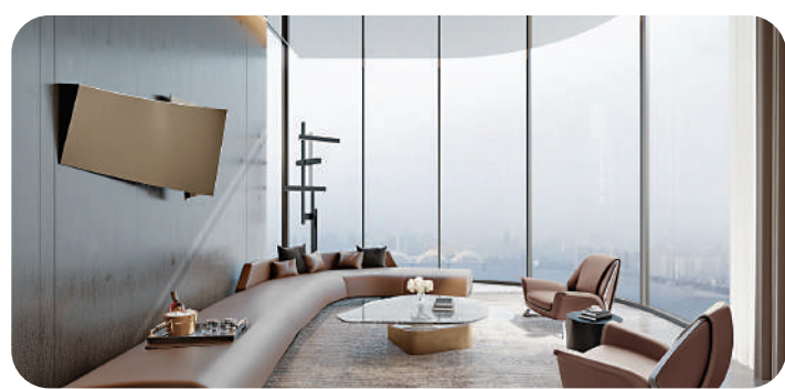
▲廣州濱江上都·璇灣181平米戶型客廳效果圖。

推薦戶型方面，一期首推戶型以建面積約163平米及181平米戶型的超寬景觀面為主。比如建面積約163平米的4房，景觀陽台貫通客廳，加上3個房間，整個觀江面寬