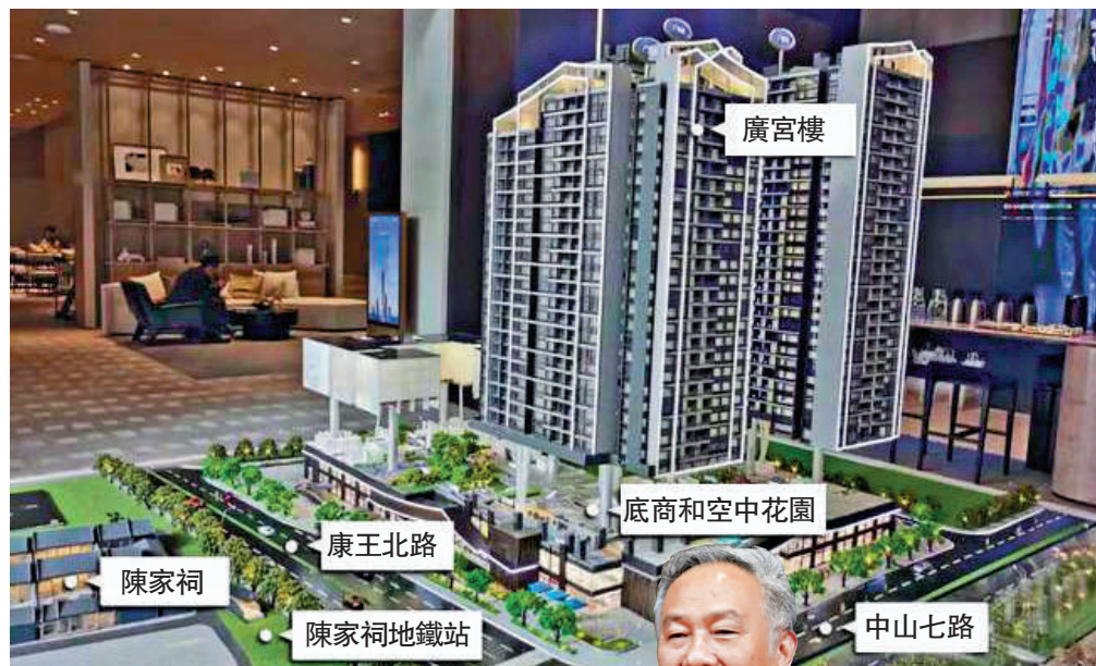
▲力迅·西關雅築樓盤沙盤。