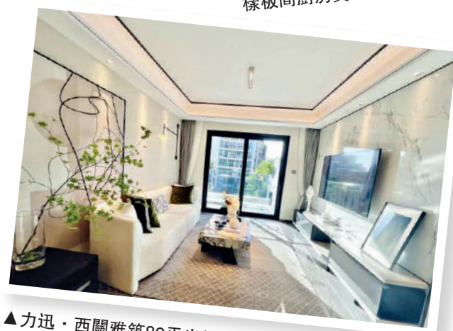
▲力迅·西關雅築89平米樣板間採光效果實拍圖。