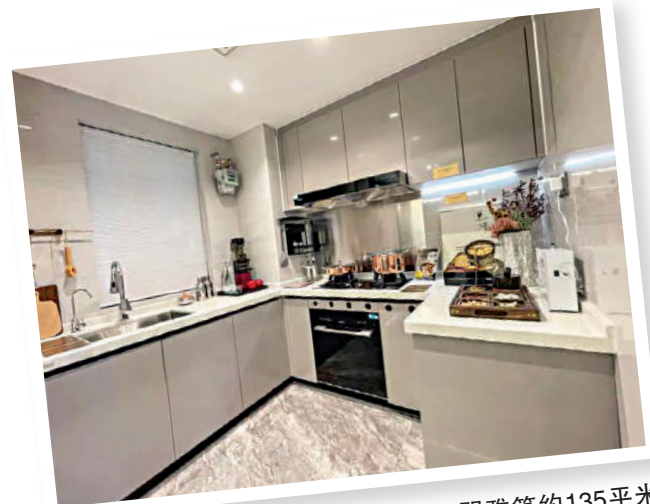
▲力迅·西關雅築約135平米樣板間廚房實拍圖。