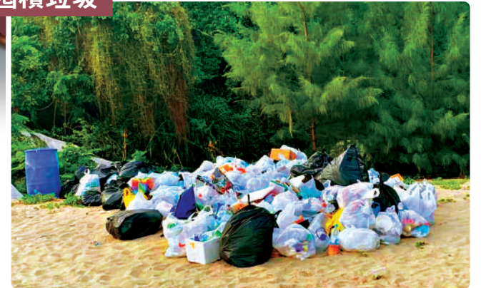
▲不少到東龍島露營的人無自行將垃圾帶走，令島上囤積大量廢物。