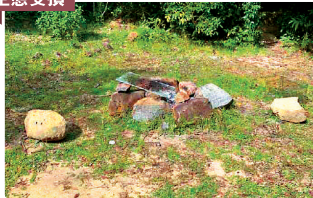
▲直接在草地或泥地上生火，會傷害泥土內的生物和附近植物。