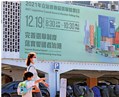
▲立法會選舉下月舉行，當局正着手敲定讓身在內地的港人於口岸投票的安排。

林鄭月娥又說，將繼續督促選舉管理委員會在特區政府各部門的全力支持和配合下，確保投票日當天的安排順暢，不容