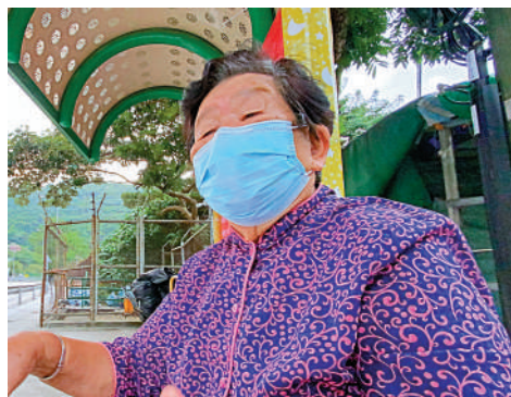
▲有女村民擔心無牌燒烤場過一段時間後會重開，希望當局大力執法。