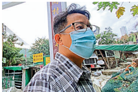
▲村民表示燒烤氣味很難聞，加上儲放了大量燒烤炭，擔心一旦發生火警，後果不堪設想。

大公報記者昨日到九華徑燒烤場了解，門口貼有「為配合政府防疫措施，本公司今天起，休息數天」的告示，但場內有多名職員在準備食材，但當記者問及何時開店時，職員隨即大聲呼喝不要拍攝及不接受訪問，其間兩名男職員更走出店外目露兇光示意記者離開。