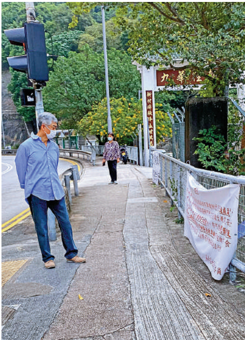
▲有關部門在九華徑兩旁行人路掛出告示，提醒市民切勿光顧無牌燒烤場。

警方上周五（19日）聯同食環署突擊搜查九華徑兩間無牌燒烤場，發現燒烤場假裝成持牌食肆一樣，門口貼有安心出行，並向顧客訛稱燒烤場屬於「B及C」類食店，但其實是無牌經營，警方遂以涉嫌「欺詐」及「無牌管有無線電通訊器具」拘捕17名燒烤場負責人及職員，同時亦以觸犯《預防及控制疾病（禁止群組聚集）規例》，向727名食客發出警告。 大公報記者黃浩輝