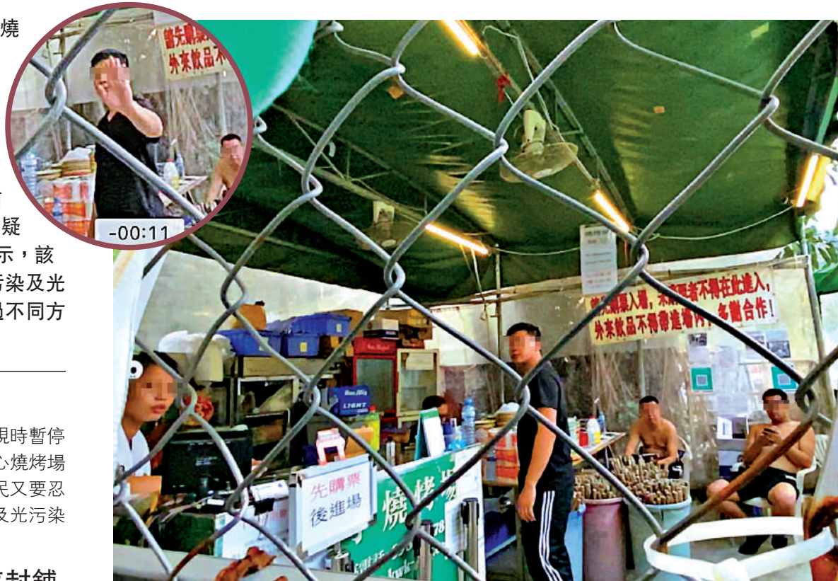
▲《大公報》記者發現有數人在無牌燒烤場內準備食材，上前查問時，有職員目露兇光，阻止拍攝並驅趕記者離開（圓圈圖示）。