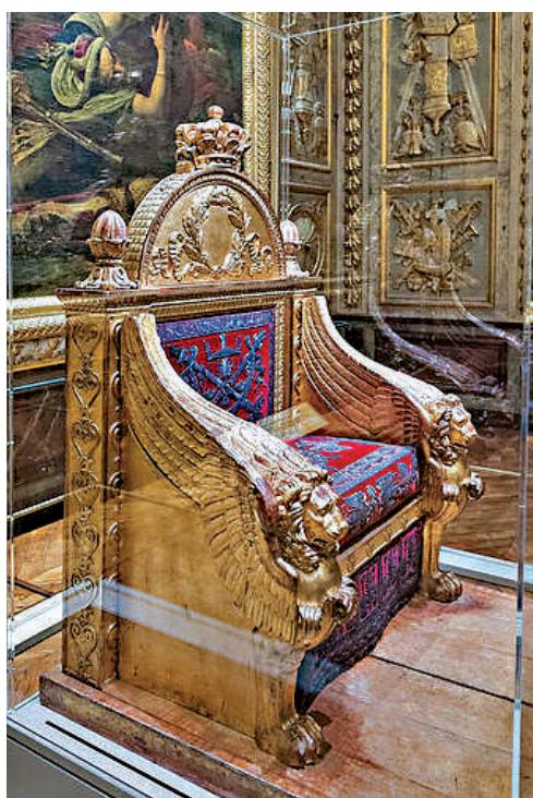
▲法國皇帝拿破崙一世的寶座。