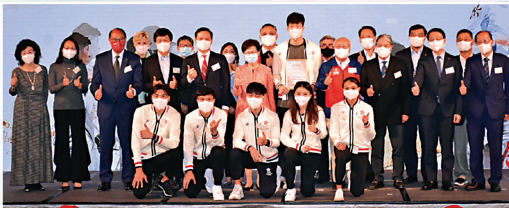
▲林鄭月娥(中排左六)等嘉賓與港劍擊隊合照。