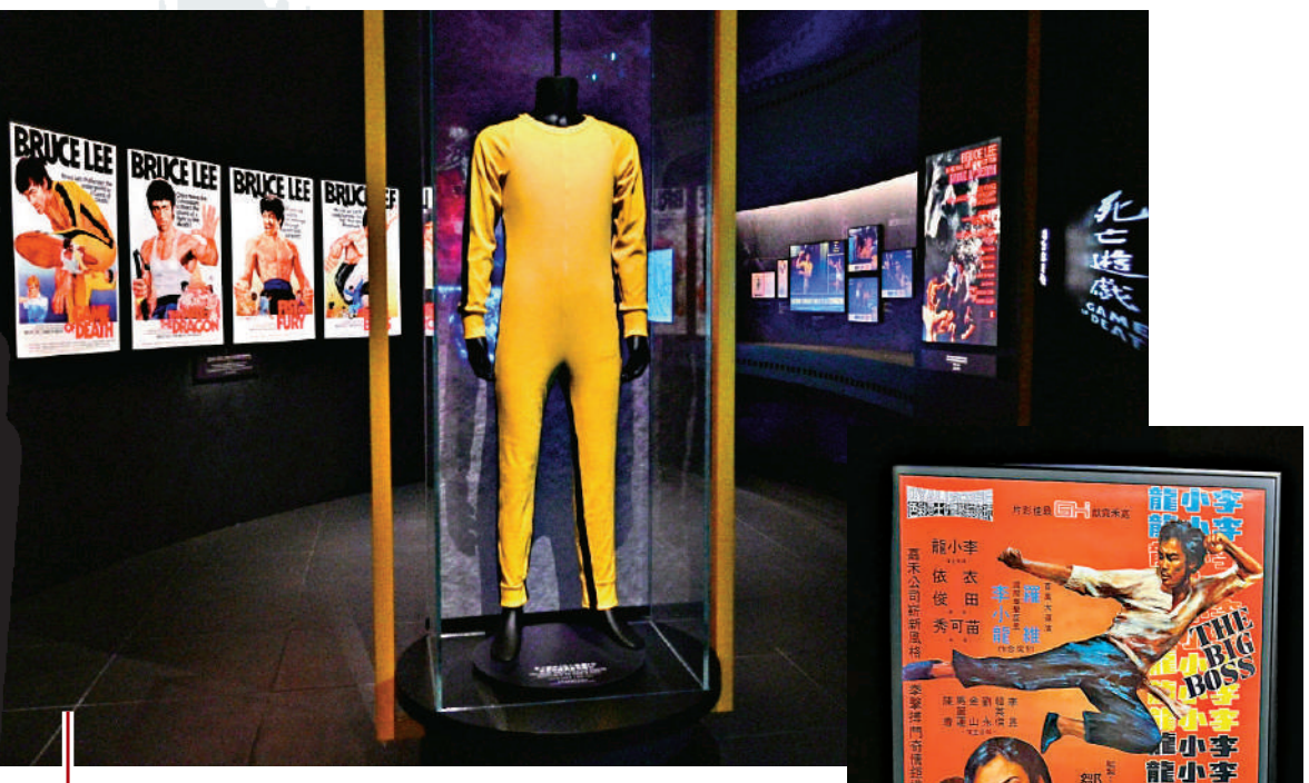
● 李小龍於電影《死亡遊戲》中穿着的經典黃色戰衣，亦成為了後期他在人們心中的經典形象代表。