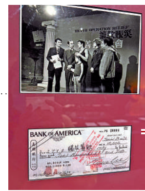
● 「六一八雨災」籌款活動照片及捐款支票（複製本）。1972年6月18日，香港雨災引發嚴重山泥傾瀉，導致過百人傷亡，李小龍與家人出席無線電視的籌款活動並慷慨捐出港幣一萬元，打破當時香港藝人的捐款紀錄。