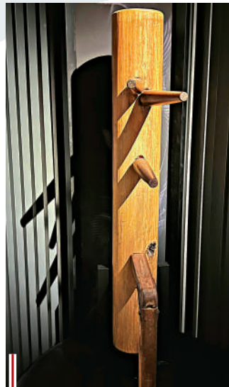
● 木人樁是詠春拳的其中一套練習器械，為練習者提供假想對手，提升實際對打技巧。李小龍早年在香港拜入葉問門下學習詠春拳，並親自改良訓練的木人樁。展館亦在一旁提供葉問與李小龍使用木人樁訓練的3D復原影片。