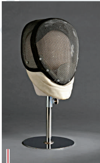
● 李小龍在香港求學時期所用的劍擊面罩。