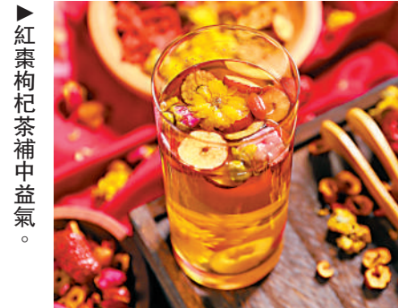
▲紅棗枸杞茶補中益氣。