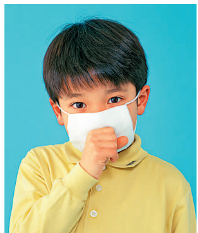
▲小朋友抵抗力較弱，此時容易患流感或上呼吸道感染。