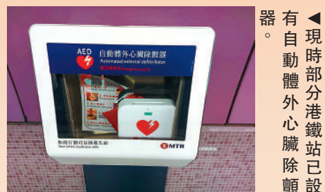
◀現時部分港鐵站已設有自動體外心臟除顫器。