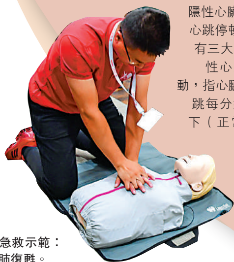
▲急救示範：心肺復甦。

心臟病泛指所有對心臟造成影響的疾病，例如冠心病、心律不正、先天性心臟病、心瓣病、心包炎等。目前只可透過心血管電腦掃描造影，預防隱性冠心病。