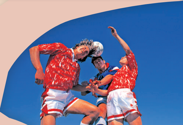
▲踢波時體能要求高，心理壓力大，會加重心臟負荷。